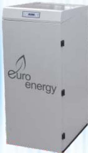
ΑΤΟΜΙΚΗ ΜΟΝΑΔΑ "CESAR"